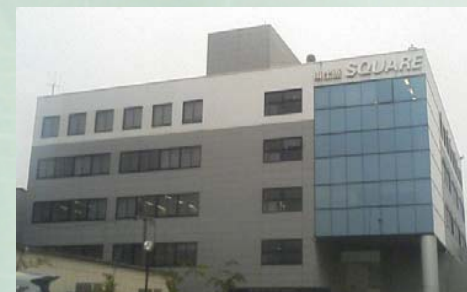
福岡支店(東比恵スクエアビル)