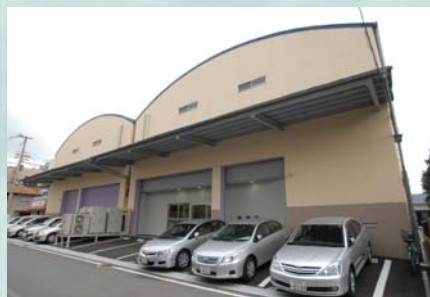
東大阪営業所・西日本物流センター