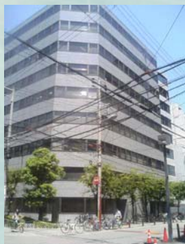
大阪支店(住友生命立売堀ビル)