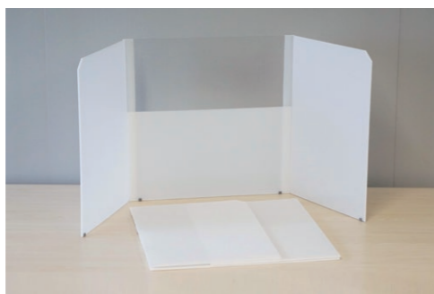
※両サイド59型透明タイプ