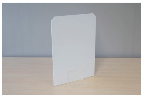
※フラットパネル40型(スタンド別売)